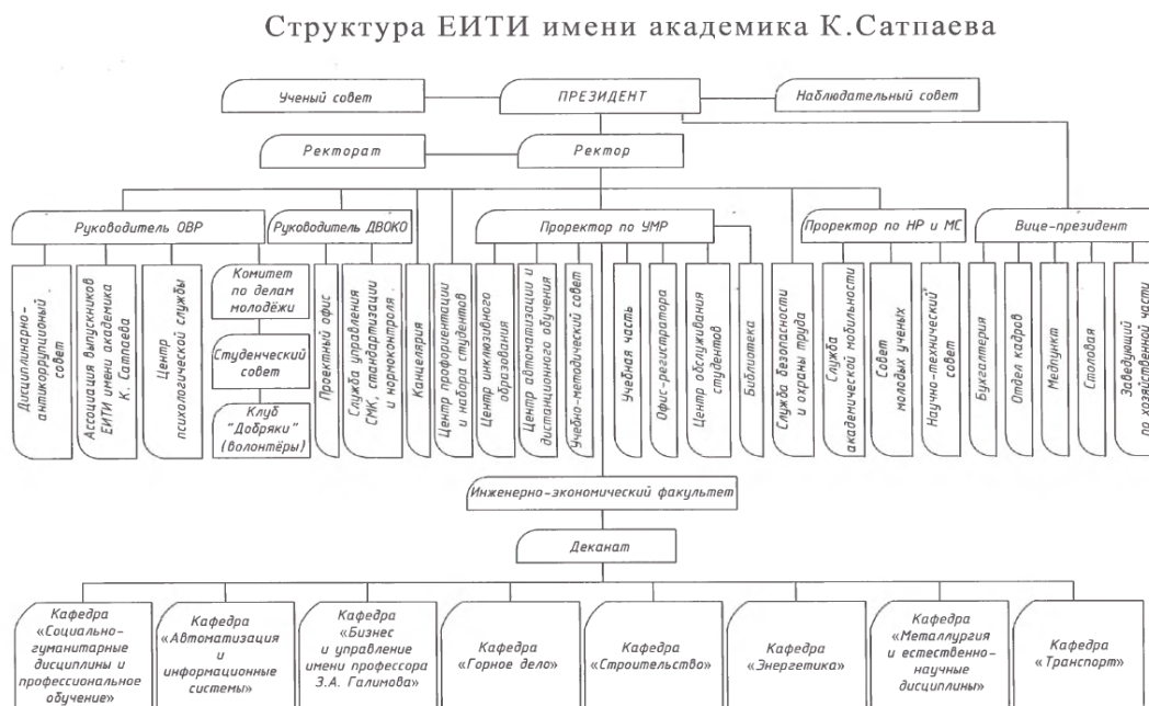
Рисунок 1 - Организационная структура ЕИТИ имени академика К.Сатпаева

В 2021 году Институтом были пересмотрены внутренние документы, регулирующие учебный, воспитательный и организационные аспекты его деятельности, с учетом действия ограничительных мер и влияния карантина, вследствие распространения пандемии коронавирусной инфекции.